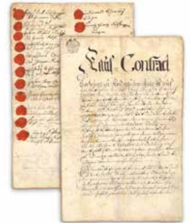
Freistädter Gründungsurkunde aus dem Jahr 1770

Wichtiger denn je sind uns unsere Rohstoffe für das Freistädter Bier. Die Braucommune in Freistadt verwendet ausschließlich österreichische Rohstoffe aus kontrolliertem, naturnahem Anbau. Unser Mühlviertler Urgesteinswasser ist die Basis für das Freistädter Bier. Quellfrisch und unbehandelt fließt es aus unserem 80 m tiefen Brunnen zu St. Peter direkt in unsere Sudkessel. Je besser das Wasser, desto besser das Bier. Unser Braumalz beziehen wir von unseren Gerstenbauern aus der Region Zistersdorf im Weinviertel. In Freistadt benötigen wir für unsere Freistädter Biere ca. 3.000 t Braugerste pro Jahr. Wir sind stolz auf diese fast 30-jährige Zusammenarbeit mit unseren Weinviertler Vertragsbauern. Damit leisten wir einen wichtigen Beitrag zur Verwendung von regionalen Rohstoffen für unser Bier. Fehlt noch der Hopfen. Seit Jahrzehnten verwenden wir ausschließlich Mühlviertler Naturhopfen, er ist die Seele für unser Freistädter Bier. Nur feinsten Aromahopfen allerbesten Mühlviertler Qualität kommt bei uns in die Sudpfanne. Den besonderen Geschmack unserer Freistädter Biere spürt und erlebt man in den Hopfennoten mit all ihren besonderen Aromen. Freistädter, das hopfige andere Bier.